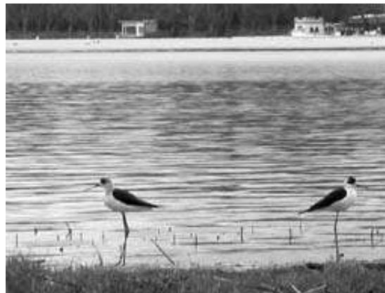
Dos camesllargues a l'Estany de Banyoles.

de detectar i que a més té el problema afegit de les confusions i hibridacions amb gats domèstics. Hi ha hagut una observació bastant continuada de camesllargues a l'Estany, vistos per molta gent que ens ha fet arribar les dades i alguna fotografia. La papallona de Graells és una espècie de papallona nocturna molt gran i una de les més boniques de la nostra fauna, que a més està protegida per la normativa ambiental nacional i europea. Finalment comentar que l'extrema duresa d'aquest hivern ha afectat molt les espècies d'ocells hivernants i residents. Els que han sobreviscut i els que han arribat més tard provinents de l'Àfrica s'han trobat una important sequera que pot afectar la reproducció d'aquest any per la disminució de recursos alimentaris. De moment, la campanya d'anellament d'ocells iniciada a la zona de la Puda està obtenint els resultats més baixos dels últims 5 anys, fet que també es produeix en altres punts de seguiment d'ocells a Catalunya.