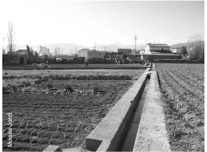
Hortes de Can Boada i ramal de l'Hort-Teixidor

Des de Limnos volem manifestar la nostra decepció perquè el projecte definitiu de l'UP-8 no permetrà protegir de forma integral la xarxa de recs i al seu patrimoni associat. Així mateix advertim que l'ordenació proposada condicionarà negativament el projecte que es vulgui realitzar al sector veí NP4 (Sota Monestir) on es concentren les millors hortes