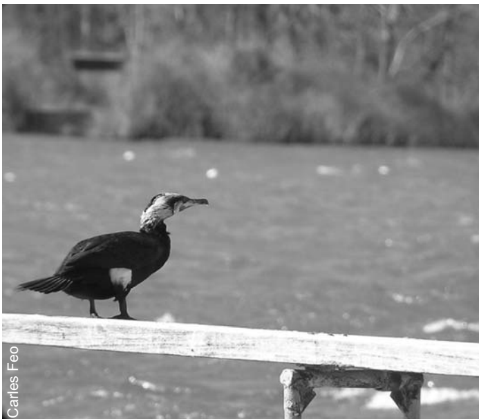
Corb marí a l'Estany

El segon trimestre de 2006 com sempre ens aporta gran quantitat d'observacions, sovint d'espècies poc comunes, especialment migrants, que acompanyen l'arribada del bon temps. Aquest any les pluges de finals de febrer han permès fer observacions interessants a Espolla, que s'ha mantingut amb aigua fins la segona setmana de maig quan es va assecar del tot.