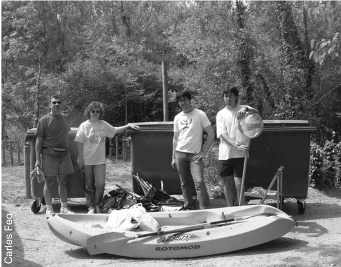
Membres de Limnos després de la neteja de l'estanyol

Per fer la neteja de dins l'estanyol Limnos ha utilitzat una embarcació cedida pel Club Natació Banyoles, al qual s'agraeix l'acció, i del qual esperem que l'Ajuntament de Banyoles prengui exemple. També hem d'agrair a l'Ajuntament de Banyoles que dies abans de la nostra activitat s'hagués decidit a fer una neteja de l'entorn de l'estanyol, i ens hagués