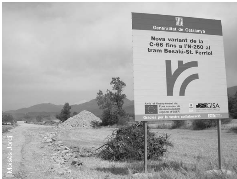
Obres de la variant de Besalú

Tampoc hi ha constància de cap seguiment de tipus arqueològic de les obres de la referida variant de Besalú i de l'extracció d'àrids i graves, tot i trobar-nos en una zona d'especial interès arqueològic. Només cal veure les troballes que s'han fet als territoris immediats: Besalú (gran quantitat de restes i troballes de jaciments de totes les èpoques històriques), Fares (troballes Paleolítiques), i Maià de Montcal (restes romanes de Can Coromines i restes Ibèriques aïllades) i les troballes paleontològiques de l'Incarcal (entre Dosquers i Crespià). És evident que no només s'ha destruït el patrimoni natural, sinó que possiblement també s'està destruint el patrimoni cultural i la possibilitat de conèixer el nostre passat.