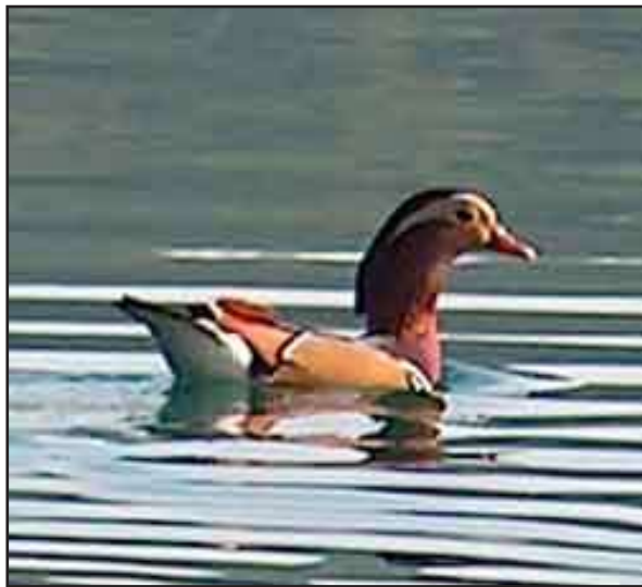
L'ànec mandarí que va visitar l'Estany.

el lluer o el durbec. El que sí que es manté és una quantitat molt gran de gavians propera als 2000 exemplars, de les més altes dels últims anys. Entremig dels gavians s'han pogut veure gavines vulgars, però també el gavià fosc i la gavina menuda que passen molt desapercebuts entre la resta de gavians, però que són espècies bastant singulars a casa nostra. La troballa d'una becada morta a Serinyà va coincidir amb l'aparició de diverses becades trobades ferides o mortes a diverses grans ciutats, segurament van entrar en bloc a Catalunya en aquella setmana provinents de terres més nòrdiques. Les poques visites al riu Fluvià han donat bones observacions com l'àguila pescadora, observada durant l'activitat de Limnos a l'Illa de Fares, però també algun disgust com la mort a trets d'un collverd dins la Reserva de Fauna. Finalment altre cop hem comptabilitzat un gran nombre d'amfibis atropellats a la carretera que volta l'Estany, un problema important per a les poblacions de la nostra comarca.