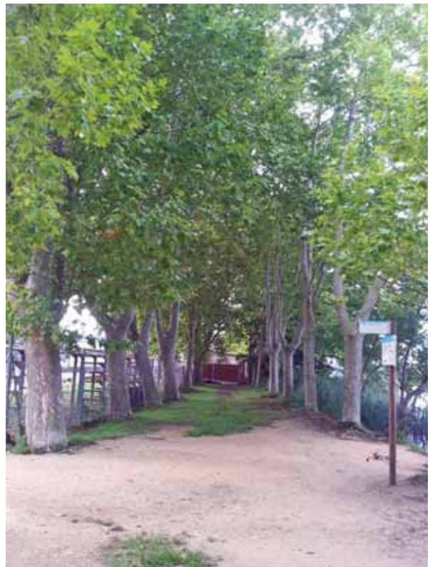
Camí actualment tancat amb una tanca delimitant el bé comunal

En la seva resposta, l'Ajuntament de Banyoles reitera que l'acord sobre l'estany és «totalment legal i bo per a la ciutat». En el nostre article d'opinió, en cap cas afirmem que l'acord sigui il·legal, sinó que «tot plegat, resulta una presa de pèl amb intenció de buscar l'argúcia legal per a permetre aquests acords». Qualsevol acord pot ser legal, però això no implica que sigui un bon acord ni que no pugui presentar certes irregularitats difícilment justificables, encara que totalment legals, això sí. Que una part del bé comunal deixi de ser-ho amb l'argument que no ha estat utilitzat durant anys, oblidant el matís que una tanca n'impedeix el pas, és una irregularitat o, repetim-ho, «una presa de pèl» cap al conjunt de ciutadans i ciutadanes que, durant anys, han vist limitat el seu dret de pas. Tot i que no constitueixi una il·legalitat, pensem que en cap cas es pot considerar bo per al conjunt de la ciutat ni per a l'espai natural de l'estany de Banyoles. Tampoc deixa de ser una presa de pèl, sempre des del nostre punt de vista, que es determini el futur, durant 50 anys, d'un espai comunal i natural sense la participació dels seus propietaris i usuaris,