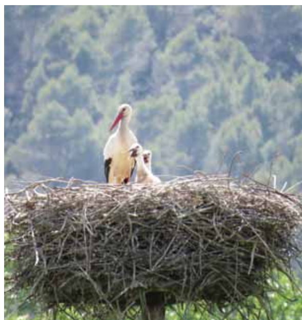
Niu de cigonya blanca de La Puda

Agost 2014. Continua funcionant amb èxit el projecte de reintroducció de cigonyes al Pla de l'Estany. La mateixa parella de l'any passat de la zona de La Puda i Pla dels Estanyols de Banyoles ha tornat a reproduir-se amb èxit amb 4 polls que ja fa setmanes que han abandonat el niu. L'any passat la parella també va criar 4 polls, tot i que finalment només en van volar 3.