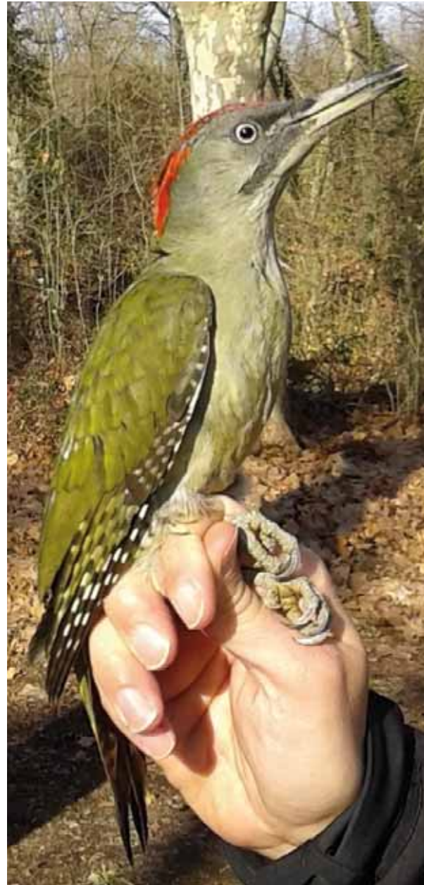
Picot verd

Les dues sessions d'aquest hivern han estat extremadament positives amb els millors resultats dels últims anys. Dels 56 ocells capturats 19 ja tenien anella i per tant en podem conèixer l'edat i l'evolució del seu pes i del seu l'estat físic en general.