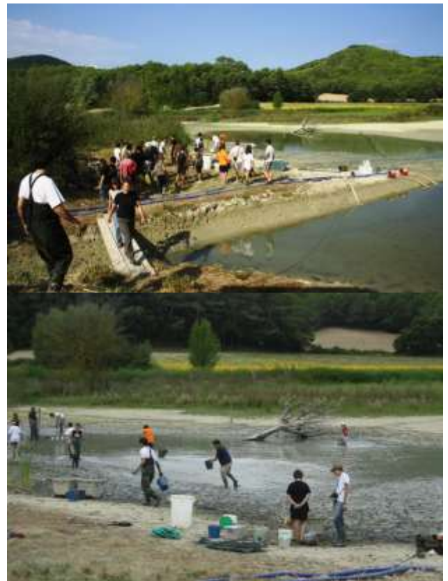
Imatges de diferents moments de l'activitat. Llacuna d'en Margarit. 29-8-09. LIMNOS